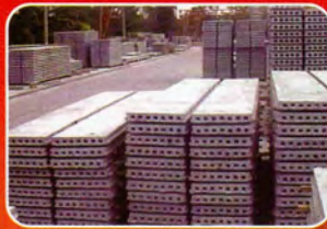
แผ่นพื้น