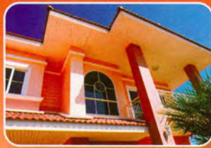
บ้านคอนกรีต