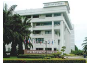
กระทรวงสาธารณสุข Ministry of Public Health