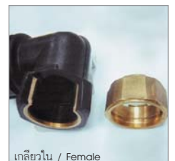
เกลียวใน / Female