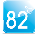
ทนอุณหภูมิได้สูง Superior Heat Resistance