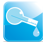
คงทนต่อสารเคมี Excellent Chemical Resistance