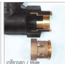
เกลียวนอก / Male