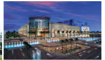
สยามพารากอน Siam Paragon