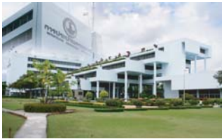
การประปานครหลวง Metropolitan Waterworks Authority