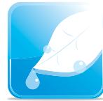
ปราศจากสารเป็นพิษ Non Toxicity