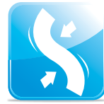
ยืดหยุ่นได้ดี Excellent Flexibility