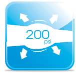
ทนแรงดันได้สูง High Design Pressure Rating