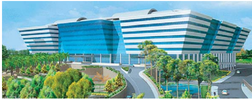
ศูนย์ราชการเฉลิมพระเกียรติ 80 พรรษา 5 ธันวาคม 2550 The Government Complex Bkk.