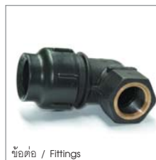
ข้อต่อ / Fittings

PBP Grab Lock Fitting is patented in mechanical compression system and thread designed. Especially, male and female threads are designed with the combination of plastic thread and metal thread. This enhancement is strength on the thread and also eliminates water leakage.