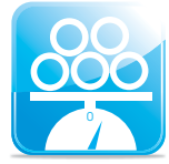
น้ำหนักเบา Light-Weight