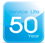
อายุการใช้งานยาวนาน Long Service Life