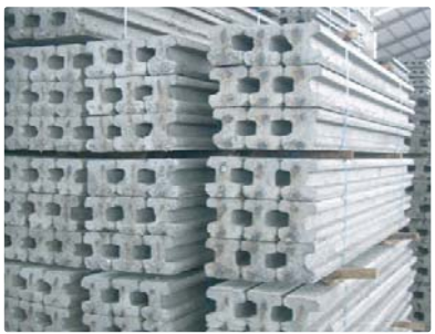
เสาเข็มไอ 12 ความยาว 1.00-4.00 เมตร ลวด PC-WIRE ขนาด 4 ม.ม. จำนวน 2-3 เส้น