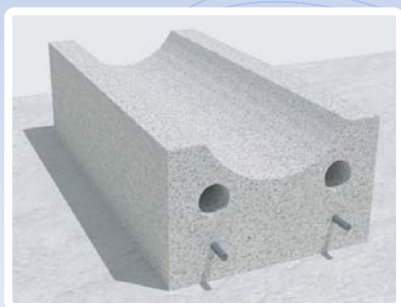
รางน้ำสำเร็จรูป รูปตัวยู ขนาด 25x50x15 เซนติเมตร