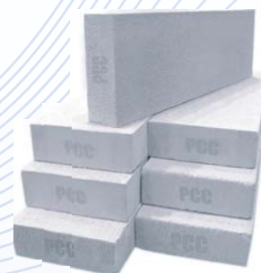
อิฐมวลเบา ตามมาตรฐาน มอก. 1505-2541