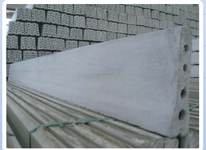
แผ่นผนังรับมาตรฐาน ความสูง 25 เซนติเมตร ความยาว 292 เซนติเมตร ความหนา 5 เซนติเมตร