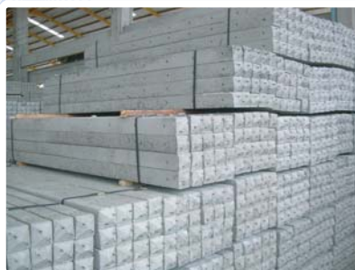
เสาหัวคองกรีตอัดแรง ขนาด 3 นิ้ว และ 4 นิ้ว ความยาว 1.00-4.00 เมตร ลวด PC-WIRE ขนาด 4 ม.ม. จำนวน 4 เส้น