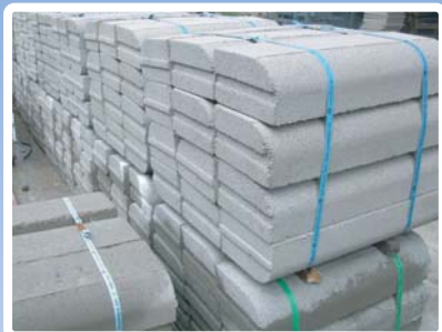
ขอบทางเท้า ขนาด 10x20x50 เซนติเมตร