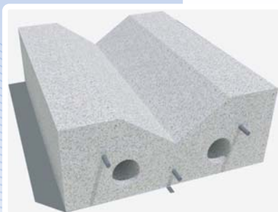
รางน้ำสำเร็จรูป รูปตัววี ขนาด 40x50x15 เซนติเมตร