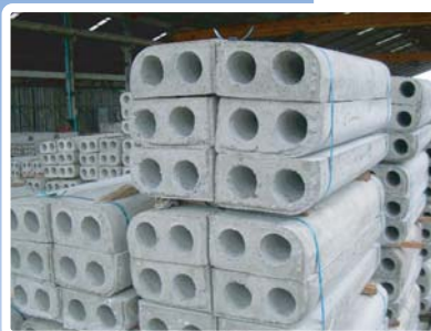
ขอบทางเท้า ขนาด 15x30x100 เซนติเมตร