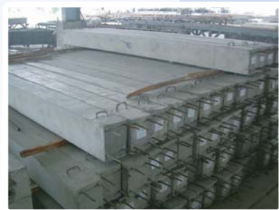
คานรับสำหรับก่ออิฐบล็อกทำกำแพง ขนาดความยาว 3 เมตร