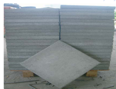
แผ่นทางเท้า ขนาด 40X40 เซนติเมตร หนา 4 เซนติเมตร