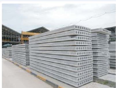
แผ่นพื้น Hollow Core ความกว้าง 120 เซนติเมตร ความหนา 10 12 15 20 25 และ 30 เซนติเมตร ตามมาตรฐาน มอก. 828-2546