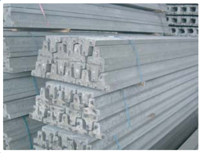
เสาเข็มคานที่ ความยาว 1.00 - 4.00 เมตร ลวด PC-WIRE ขนาด 4 ม.ม. จำนวน 5 เส้น