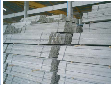
เสาเข็มคานที่ ความยาว 1.00-4.00 เมตร ลวด PC-WIRE ขนาด 4 ม.ม. จำนวน 5 เส้น