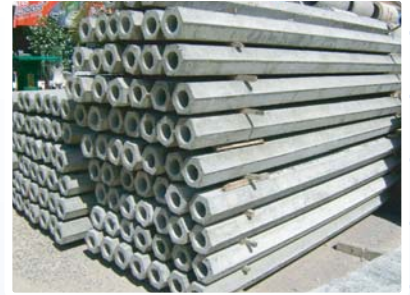
เสาเข็มทกเหลี่ยมกลวง ความยาว 1.00-6.00 เมตร ลวด PC-WIRE ขนาด 4 ม.ม. จำนวน 4 เส้น พร้อมปลอกเสา