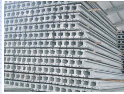
เสาเข็มไอ 15 ความยาว 2.00-6.00 เมตร ลวด PC-WIRE ขนาด 4 ม.ม. จำนวน 4 เส้น พร้อมปลอกเสา