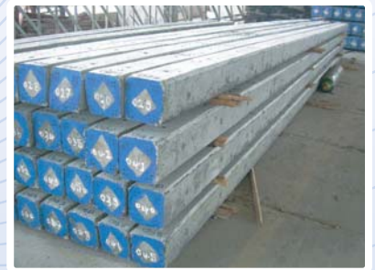
เสาไฟฟ้า (ตามมาตรฐานการไฟฟ้า)