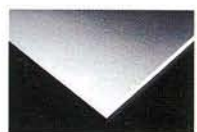
อลูมิเนียมฟอยล์