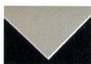
แผ่นยึดติดทนชื้น